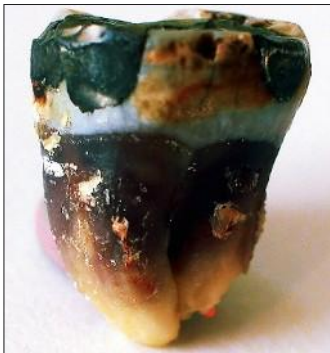
Metalle aus einer Amalgamfüllung sind in den Zahn eingedrungen und haben ihn dunkel verfärbt.

Die Betroffenen suchen oft einen Arzt nach dem anderen auf, ohne dass die wahre Ursache gefunden und ihnen wirklich geholfen wird. Oft zweifeln sie selbst daran, ob mit ihnen „alles stimmt“ und manchmal werden sie von den Ärzten als psychosomatischer Fall abgestempelt.