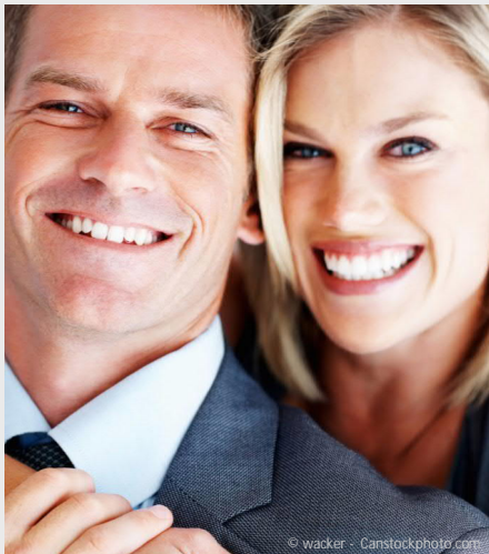
Selbstsicher mit gepflegten Zähnen

Dann werden Mund, Zähne und Zahnfleisch untersucht. Die Zahnbeläge werden angefärbt, um sie besser sichtbar zu machen und es wird die Tiefe der Zahnfleischtaschen gemessen.