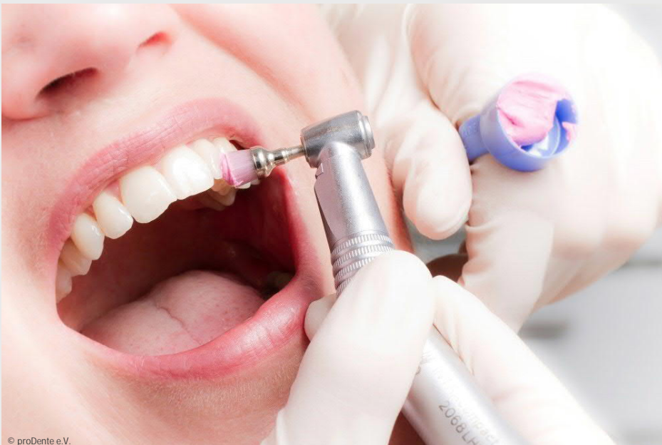
Die Professionelle Zahnreinigung wird von speziell ausgebildeten Prophylaxe-Fachkräften ausgeführt und ist eine lohnende Investition in die eigene Gesundheit.

Vertrauen Sie Ihre Zahngesundheit Profis an!